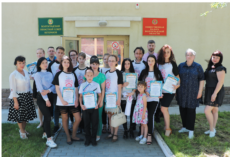
Участники конкурса плакатов об АГС