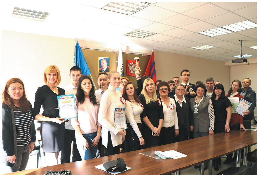
Участники конкурса «Армия будущего глазами юриста», студенты юридических клиник